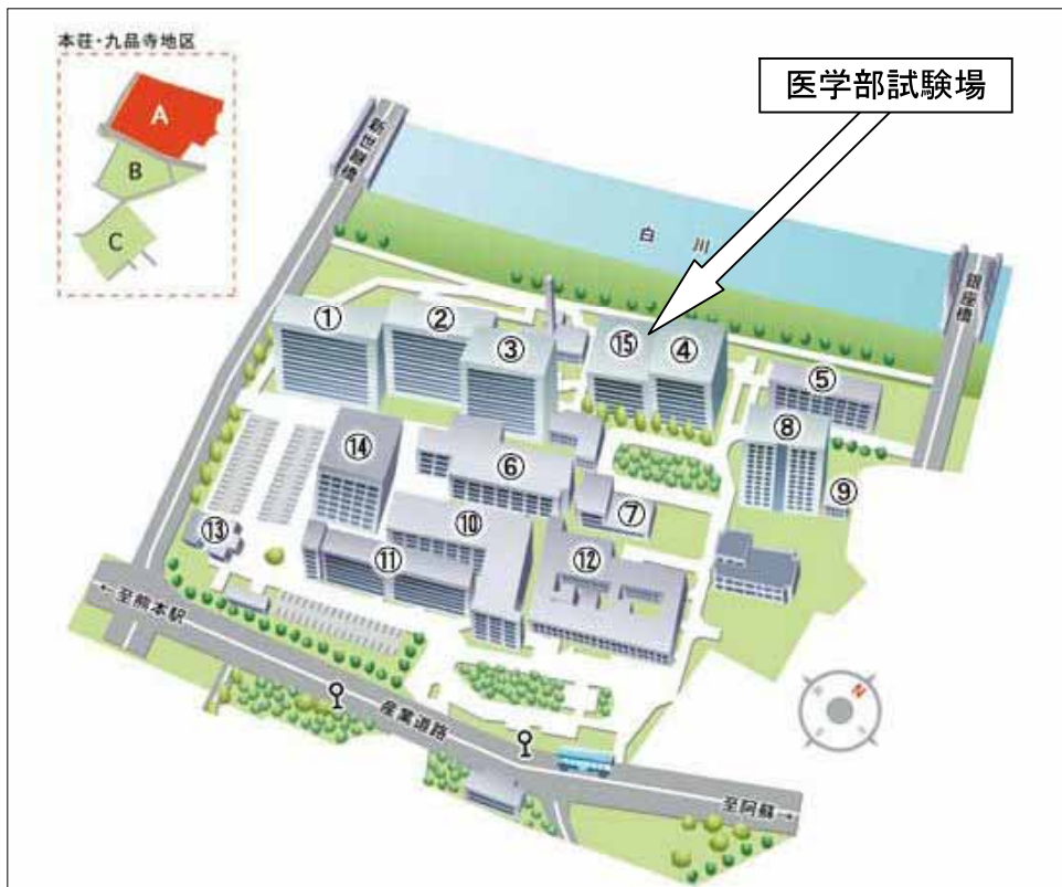
医学部試験場 ⑮医学教育図書棟